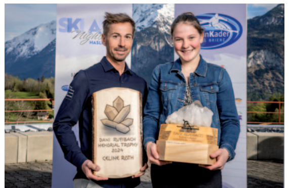
von links nach rechts:

Die Organisatoren schauen auf einen erfolgreichen, in-