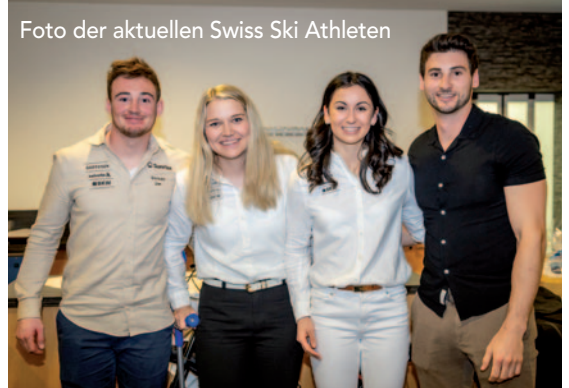
Foto der aktuellen Swiss Ski Athleten